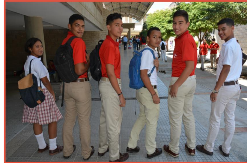
PROPUESTA PARA ESTUDIANTES ANTIGUOS 2018

INFORMES: Teléfono:(+57)(5) 5851803 • Calle 1 No. 38-13 Avenida Sierra Nevada Km 4 • www.colegiocomfacesar.com